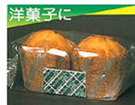
各水分活性値でのフレッシュドット必要量（食品 100g 当り）

食品の水分活性値(Aw)と重量を測定の上、包装資材と賞味期限の設定によりフレッシュドットのグレードを選定して下さい。